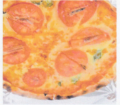
トマトとパピルのピッツァ